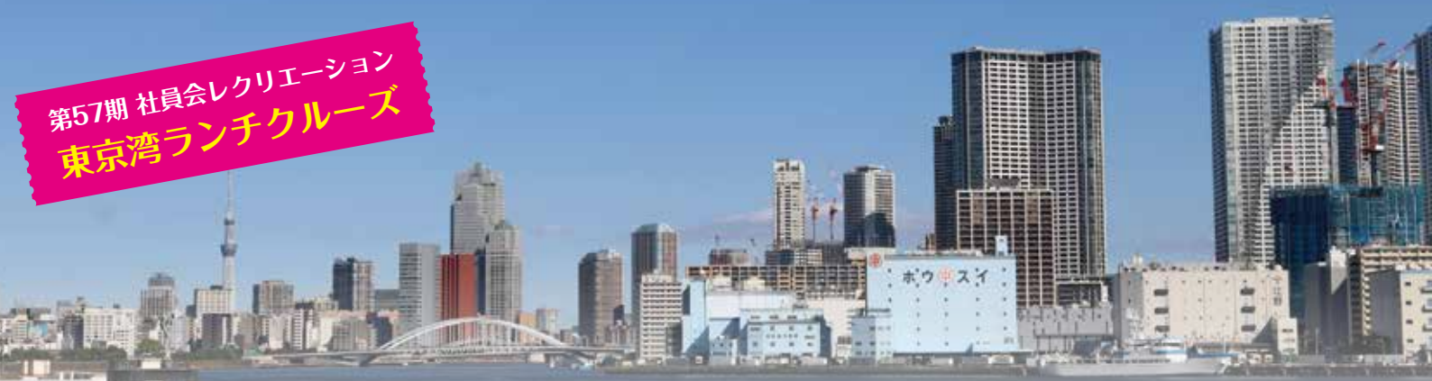
各自デッキに出て思い思いに景色を楽しんだり、 写真を撮ったりしていました