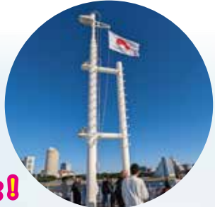
社旗を飾っていただきました！