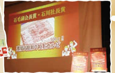
高級お菓子やワインなどが当たるお楽しみ抽選会も実施されました。これで終わりかと思いきや…。 特別賞も!!おいしいお土産をgetできたみなさんおめでとうございます!