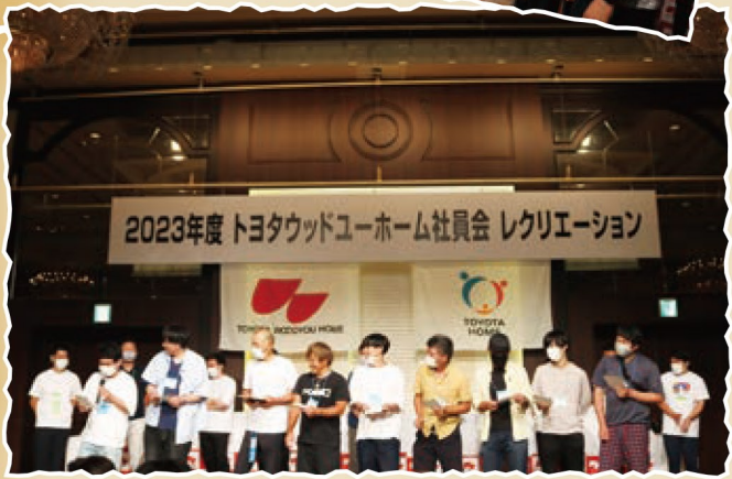
下位4チームはチャレンジゲームに挑戦!当たりくじ(?)をひいたチームはみんなの前で合唱♪